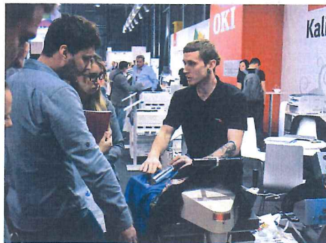
↑ Praktické ukázky tiskových aplikací na stánku společnosti OKI.