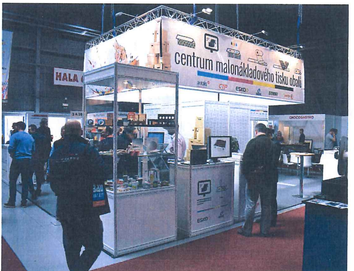
↑ Na tomto stánku si návštěvníci mohli prohlédnout celý proces malonákladové výroby obalů.

Naše redakce se letošního 24. ročníku mezinárodního veletrhu Reklamy, Médii, Polygrafie účastnila jak v roli vystavovatele, tak v roli návštěvníka. V prostorech výstaviště PVA EXPO v Letňanech jste mohli ve dnech 24.–26. dubna navštívit náš stánek, který byl zaměřen na propagaci novin pro grafický průmysl. Kromě toho jsme návštěvníkům nabízeli možnost vyzkoušet si několik aplikací, o kterých jsme nedávno psali v novinách. Mohli si tak vyzkoušet monitor Eizo a nový systém Quick Color Match, objevit možnosti měření s přístrojem X-Rite eXact nebo zjistit více informací o produktech Enfocus.