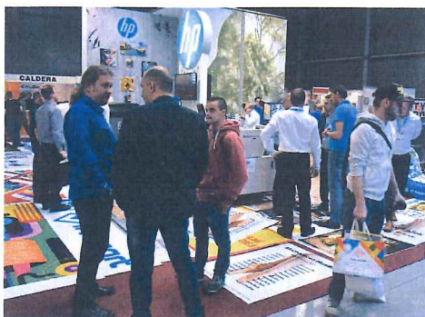
↑ Zájem návštěvníků byl letos opravdu veliký.