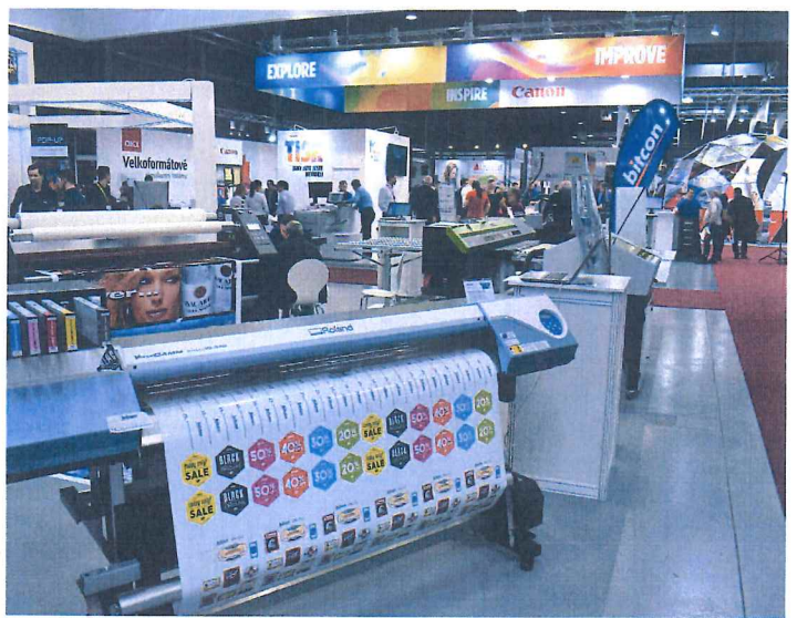
↑ Rozmanitě výstavní expozice na veletrhu Reklama Polygraf.